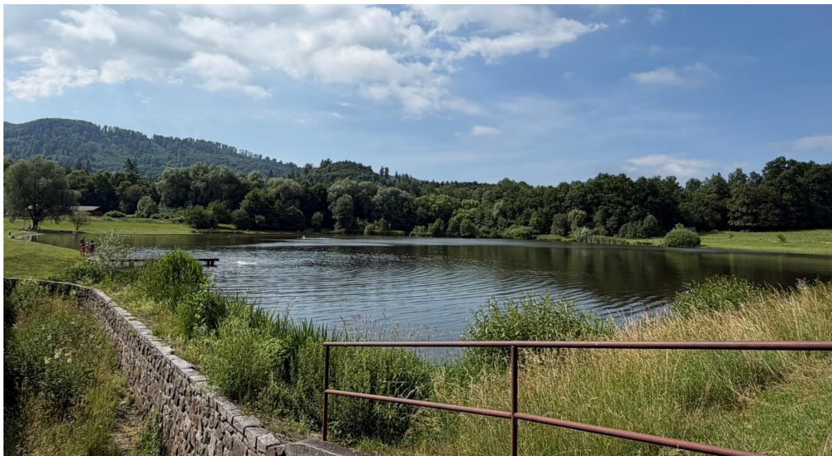
VN Kacabaja, okres Nový Jičín, Foto: KHS

Slunečné a teplé počasí posledních dnů mnohé z nás láká k návštěvě koupacích míst. Ve 26. kalendářním týdnu pokračovaly kontroly kvality vody v okresech Bruntál (Slezská Harta, rybníky Tvrdkov, Edrovice a Pod hradem v Bohušově, lom Svobodné Heřmanice), Opava (Stříbrné jezero, vodní nádrž Budišov nad Budišovkou) a Nový Jičín (nádrže Kacabaja v Hodslavicích, Údolí mladých v Bílovci, Čerták v Novém Jičíně a Větrkovice v Kopřivnici).