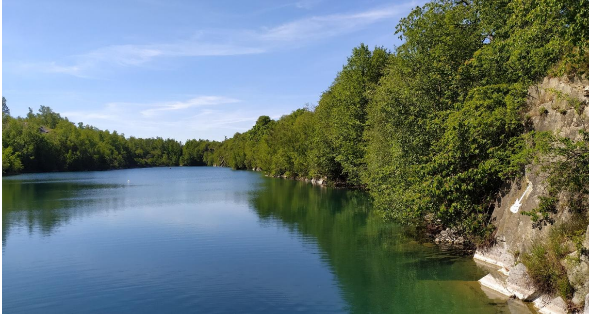
Lom Svobodné Heřmanice, okres Bruntál

Kvalita vody v ostatních uvedených vodních nádržích je vhodná ke koupání.